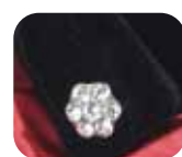
ラ・ヌクーベルベット

シルクハットを作る日本の帽子職人の匠の技で、一品一品手作りで縫い上げております。そうした職人の作業から丁寧な仕上がりを実現しました。